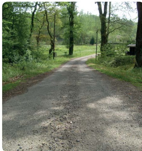
Assurer la sécurité