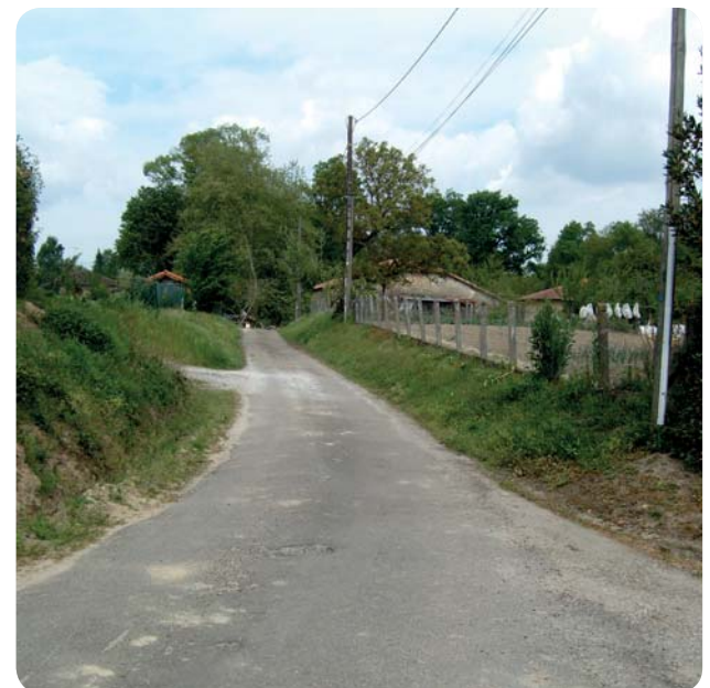
Vingt communes réaliseront des travaux de voirie