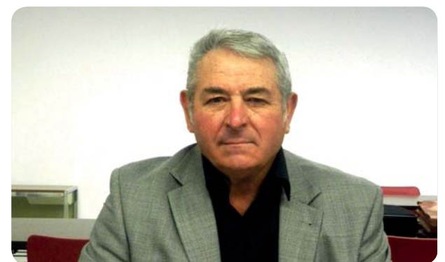
Vingt communes concernées par les travaux de voirie