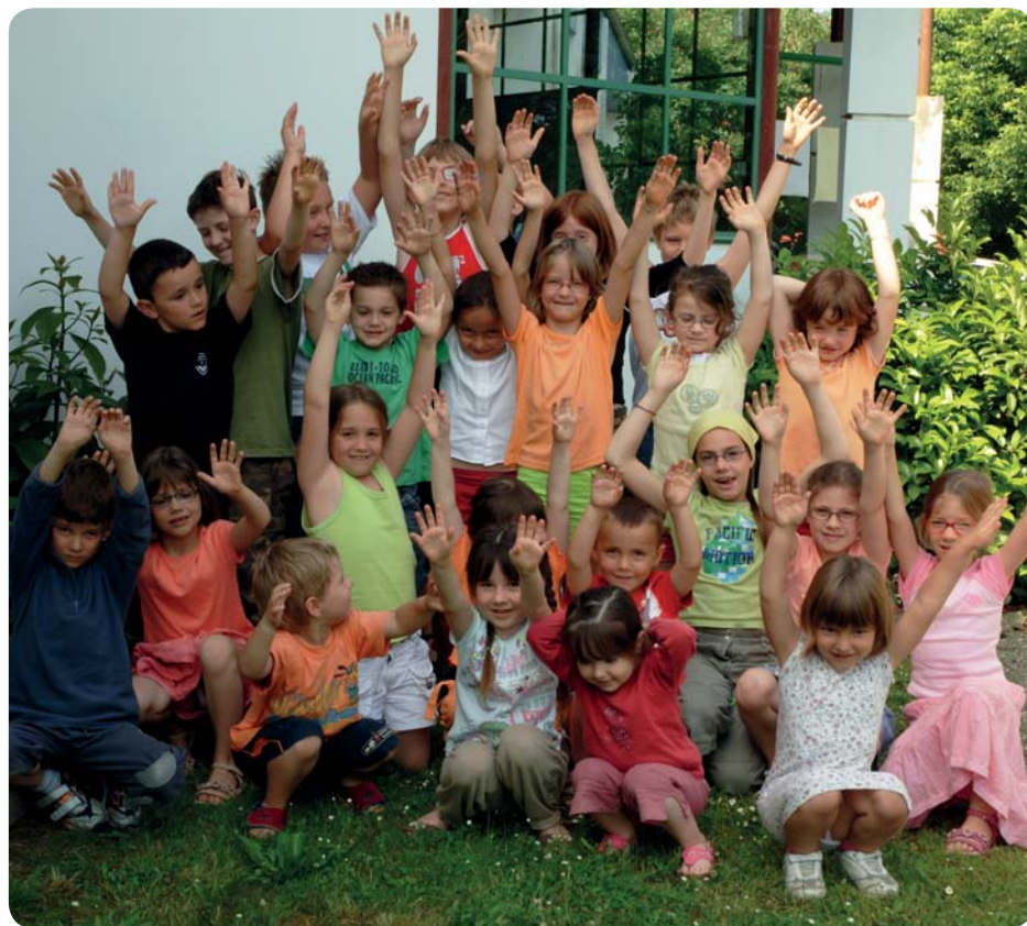
Le 28 mai : tous à la Fête de la jeunesse

www.cc-montfortenchalosse.fr - Service accueil de loisirs : 05 58 98 59 80