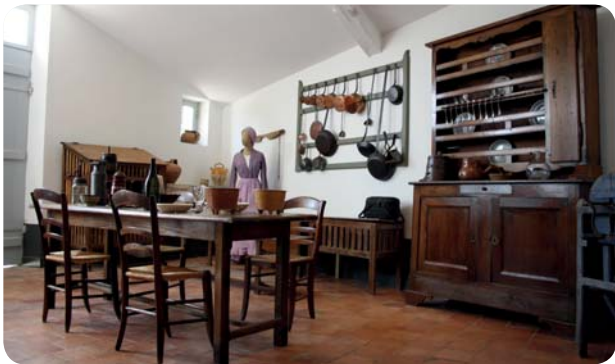
La cuisine de la maison du maître de Carcher

Un voyage gourmand dans l'histoire de nos assiettes. Du 1 er juin au 1 er décembre.