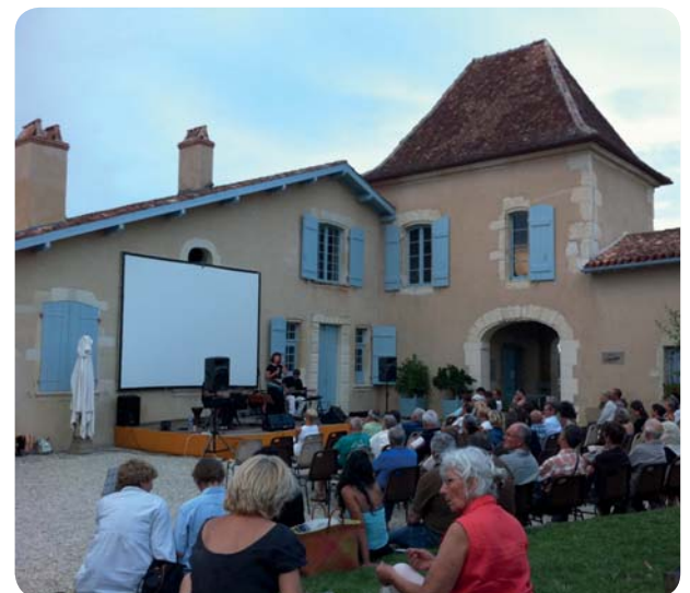
Un soir au musée

Pour mener à bien ce travail, la Communauté a choisi de s'appuyer sur l'agence culturelle PLANETH (Patrimoine, Loisirs, Arts, Nature, Economie, Tourisme, Hébergement) afin de croiser les problématiques culturelles et touristiques. Il s'agit de réactualiser la feuille de route du musée en croisant l'état des lieux, l'analyse du parcours du musée, mais aussi son implantation économique et touristique et ses outils de communication. Cette première étape sera suivie à l'automne d'une proposition d'un programme d'actions opérationnelles chiffrées et pourra s'accompagner dans un premier temps, d'une nouvelle identité graphique.