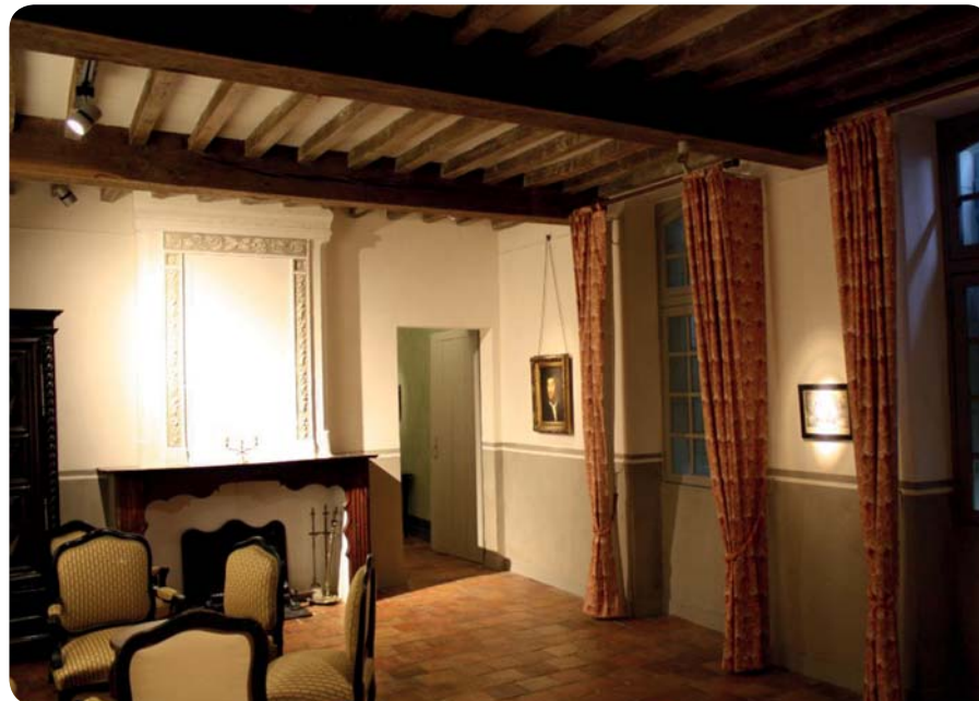
Les peintures murales respectent celles du XIX e siècle