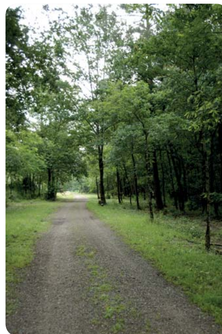
Voie verte de Chalosse

Des outils de communication et de promotion accompagneront cette démarche de mise en valeur de la voie verte de Chalosse.