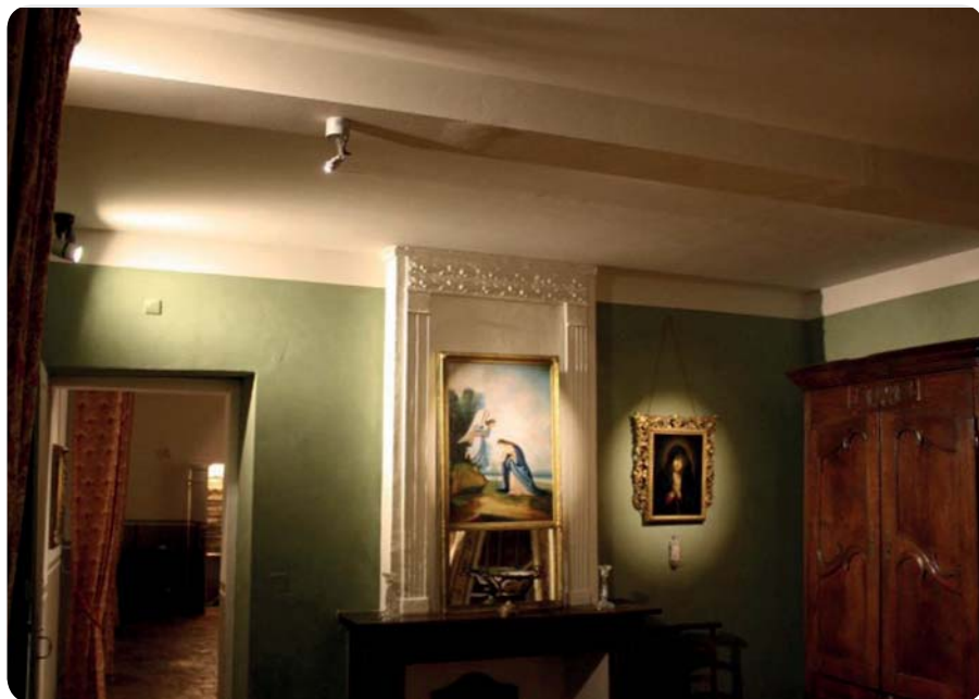
Un nouvel éclairage pour les collections

Au domaine de Carcher à Montfort-en-Chalosse, la maison de maître vient d'être restaurée. A ses côtés, la maison et le jardin du métayer, le chai et son pressoir, le conservatoire des cépages locaux, le fournil en activité renvoient à la Chalosse du XIX e siècle et à ses savoir-faire. La valorisation du patrimoine : un axe fort de la politique culturelle de la Communauté de communes.