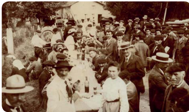
Une fête de village dans le Gers, tirage argentique, début du 20 e siècle

Avec l'exposition temporaire « Cuisinières et marmitons », le Musée de la Chalosse choisit d'interroger le symbole de « terre du bien vivre et du bien manger » que véhiculent le bocage chalossais et la Gascogne, terres de haute tradition gastronomique. Un parcours au gré des ingrédients, des ustensiles, de livres de recettes, des menus, des témoignages mais aussi des discours et des