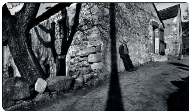
L'exposition Depardon a rencontré un grand succès