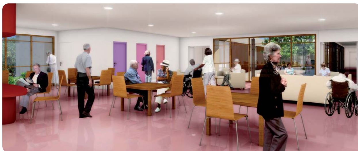
Un projet architectural fonctionnel pour le confort des résidents et du personnel.

La nouvelle maison de retraite s'étendra sur 3 018 m 2 de SHON sur un terrain de près d'un hectare, suffisamment grand pour permettre un