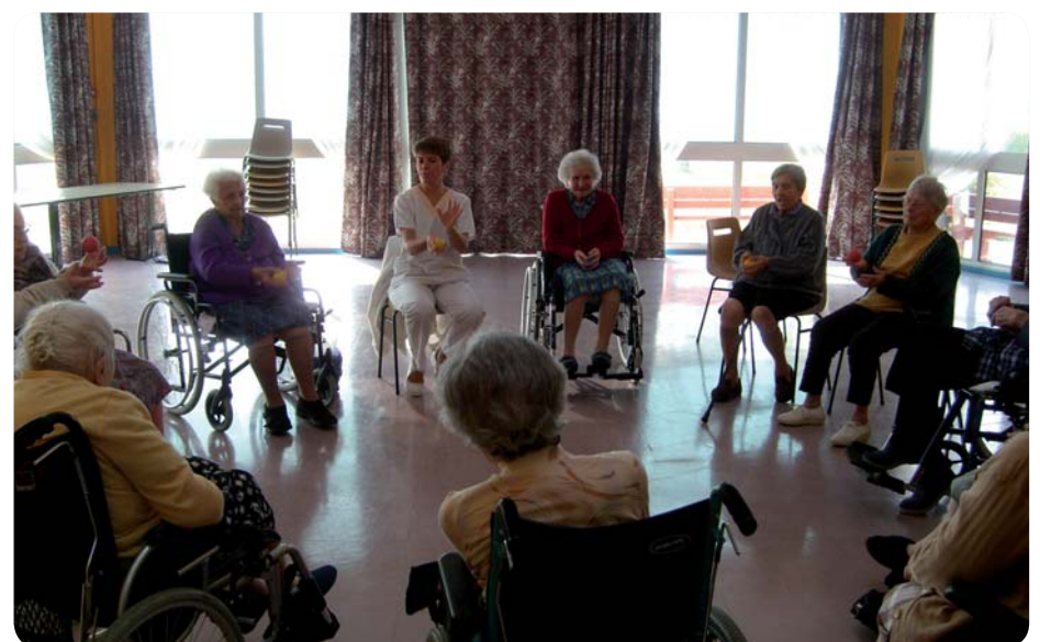
Les animations avec les résidents, temps forts du quotidien.

repas à thème, un goûter viennois. Le jour où la garbure figure au menu, les pensionnaires qui le souhaitent peuvent éplucher les légumes. Au cours d'une sortie au Musée de la Chalosse, certains sont redevenus acteurs de leur repas en fabriquant le pain. Le théâtre, la danse ou la musique classique entrent aussi dans les deux établissements. Les jeunes de l'école de musique répètent dans la maison de Montfort et les collégiens viennent à la rencontre des personnes âgées à l'occasion d'initiation au gascon.