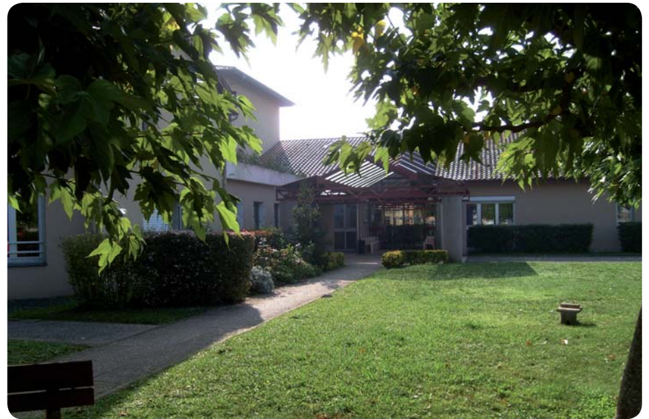
Un budget de 700 000 € est consacré aux travaux de la maison de retraite de Montfort.

Le petit parc à l'entrée de l'établissement et celui situé à l'arrière du bâtiment sont désormais sécurisés pour éviter que les patients atteints de la maladie d'Alzheimer ne risquent de s'égarer. Le jardin est agrémenté d'une piste