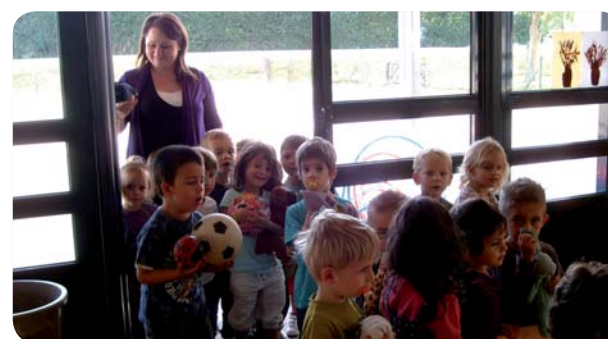
Des enfants et des animateurs épanouis.

Durant le 1 er mois des vacances d'été, l'association Haute Chalosse assure l'accueil de loisirs, pour les 3-6 ans à Poyanne, pour les plus de 7 ans à Mugron. Du 6 juillet au 5 août dernier, les 22 animateurs (11 à Mugron et 11 à Poyanne) et 4 directeurs ont conduit les jeunes sur les chemins des Landes pour une multitude d'animations, sur le thème « Les pirates et le monde marin » à Poyanne, alors qu'à Mugron on explorait « Le voyage à travers le temps ». Camps équitation ou vélo, veillées, sorties ou ateliers théâtre, hip hop parmi bien d'autres activités séduisent de plus en plus les jeunes. Aussi, il n'est guère étonnant que l'effectif ait augmenté de 16% en 2010 par rapport à 2009.