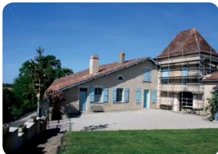
Un échafaudage dans la cour du Domaine de Carcher.

Les travaux vont bon train au Musée de la Chalosse. A la fin du mois de juin, la première partie de la maison de maître a pu être ouverte à la visite, tandis que les collections quittaient les cuisines, salle à manger, souillarde et bûcher, afin d'entamer la seconde phase de rénovation du bâtiment. Avec les beaux jours ont pu commencer les travaux sur les façades extérieures, les corniches et les toitures, ce qui a nécessité la mise en place d'un