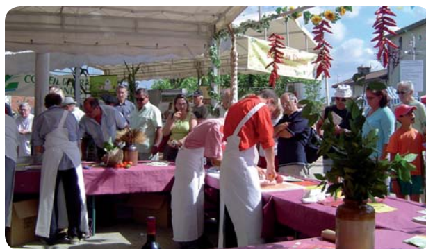
Une journée pour faire découvrir au grand public le savoir-faire des professionnels de la filière.

En plus de ce concours, de nombreuses animations sont chaque année proposées. Les gourmets font une halte à l'espace dégustation. Un peu plus loin, à la ferme des enfants, petits et grands découvrent des espèces peu ordinaires. Enfin, le concours des veaux déguisés permet à des associations locales, couplées à des bouchers labélisés bœuf de