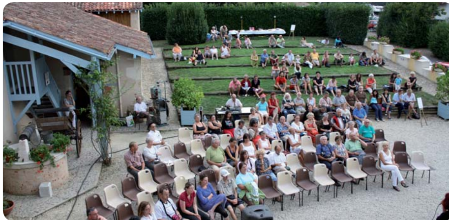
Le public a répondu présent pour cette première édition de la Soirée d'été.

Une soirée d'été sous les étoiles La première Soirée d'été en Chalosse s'est déroulée le 26 août dernier dans la cour d'honneur du musée. Cette manifestation autour de la langue gasconne et des langues d'ici ou d'ailleurs, a rassemblé une centaine de personnes. Par cette chaude soirée d'été, elles ont profité du théâtre de verdure pour écouter le tour de chant de Mayo, chanteuse et poétesse gasconne, avant d'admirer la verve de Cyrano de Bergerac, invité d'honneur du Domaine de Carcher... Pendant l'entracte, la buvette tenue par les Amis du musée a permis aux visiteurs de pique-niquer sur place.