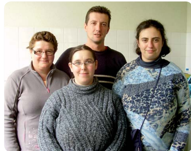
Les stagiaires en formation d'opérateur agro-alimentaire.

Accueil du public Lundi : 9h à 12h30 - 13h30 à 17h30 Mercredi : 9h à 12h30 Vendredi : 9h à 12h30 - 13h30 à 16h30