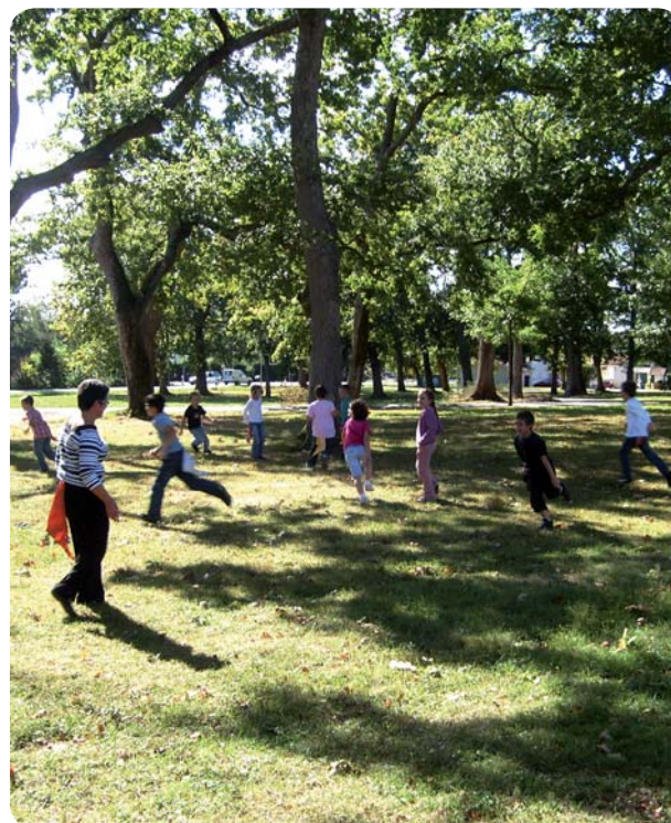
Jeux collectifs à Cassen.

Pour faciliter la mise en œuvre de cette nouvelle organisation et la vie des parents, les élus de la Communauté ont choisi de l'accompagner par la mise en place d'un transport collectif. Les familles ont la possibilité de déposer et de récupérer leurs enfants sur l'accueil de loisirs le plus proche de leur domicile. C'est ensuite le bus qui conduit les enfants sur leur accueil de loisirs le matin et qui les ramène le soir à des horaires bien précis.