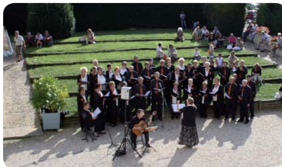
La chorale Cante Chalosse sur le théâtre de verdure.

À l'invitation de la commune de Montfort-en-Chalosse, le Musée de la Chalosse a participé au parcours-promenade proposé le 18 septembre sur les traces de Marcel Saint-Martin, peintre et poète bien connu à Montfort. La chorale Cante Chalosse a ainsi interprété dans la cour d'honneur du musée des chansons et poèmes qu'il avait mis en musique.