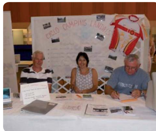
Le Club cyclo à la rencontre du public.