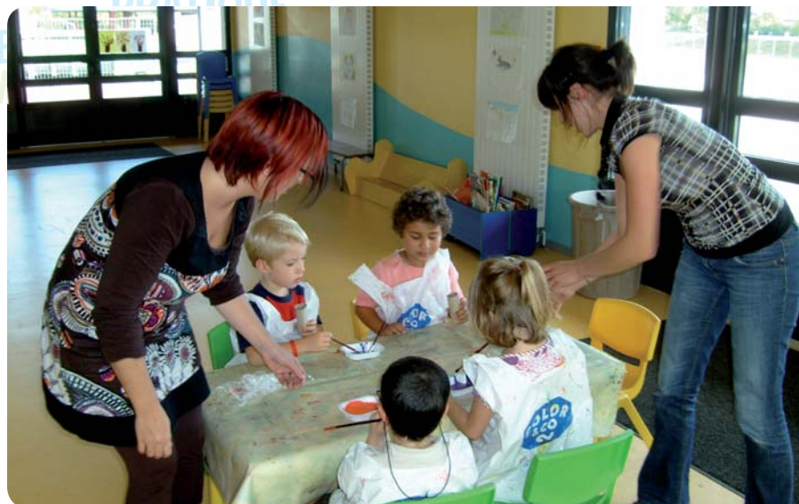
Des animations adaptées à chaque âge.