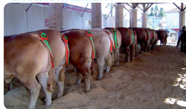
Des lauréats sagement alignés.

Chalosse, de donner libre cours à leur imagination en déguisant des veaux et en décorant leur box. A l'issue d'une matinée bien remplie, un grand repas gastronomique animé par des bandas et des