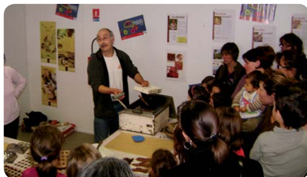
Des rencontres autour de spectacles vivants.

La Communauté de communes et les communes de Cassen, Goos, Hinx et Poyanne financent ensemble le poste de l'animatrice du réseau. La Communauté de communes contribue au financement des animations proposées, notamment