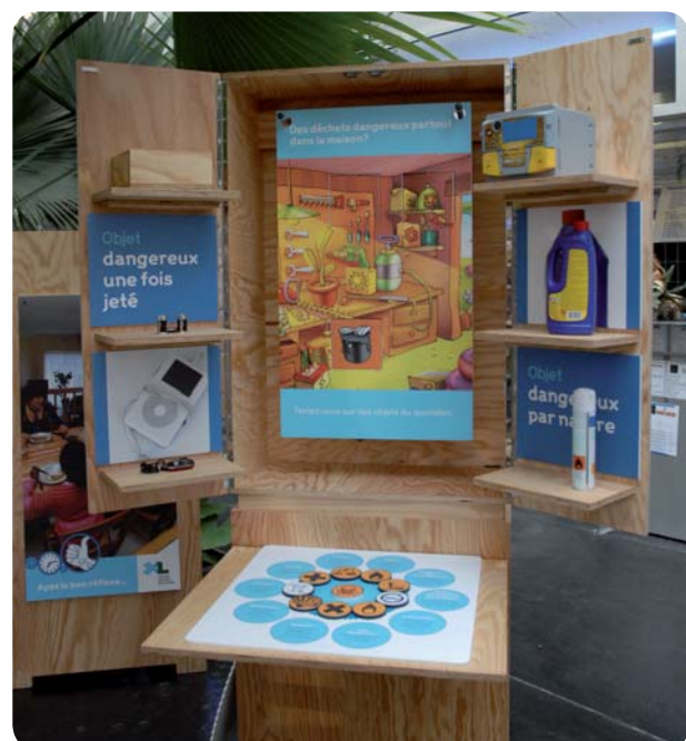
Une scénographie originale et ludique.

éducation à l'environnement du Plan départemental de prévention des déchets piloté par le Conseil général des Landes.