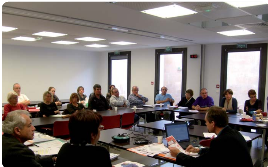
Un séminaire participatif sur les pratiques d'achats.

des produits d'entretien, mutualiser les achats de papier ou de fournitures de bureau et réaliser des économies, élaborer des fiches produits. De nouveaux rendez-vous de travail sont programmés pour passer de la réflexion à l'action.