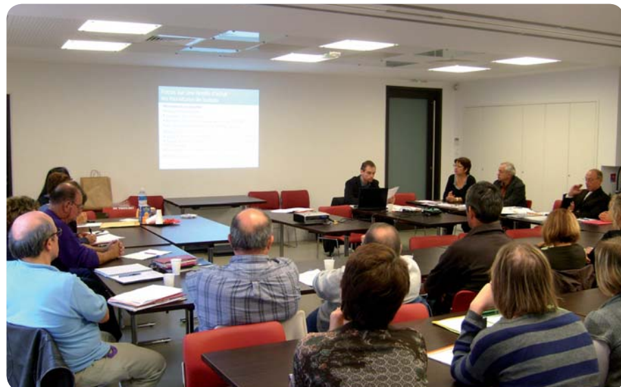
Acheter mieux pour réduire les impacts environnementaux.