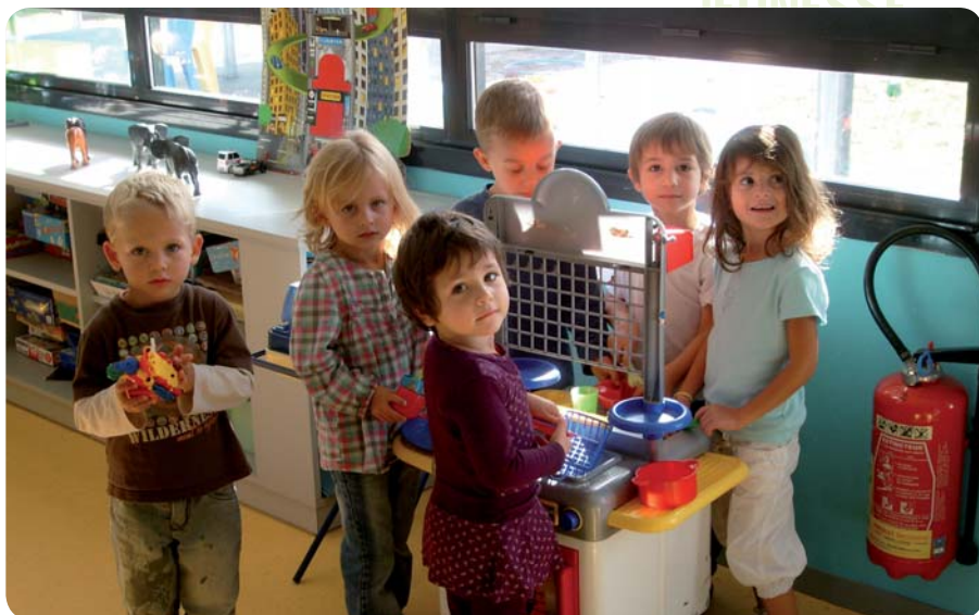
Ambiance cocooning pour les plus petits.