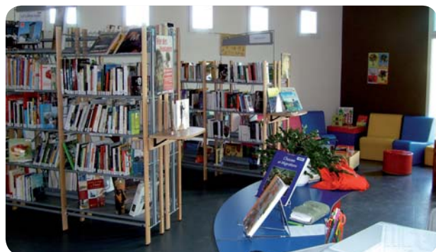
Des livres pour tous.

Les médiathèques de Cassen, Goos, Hinx et Poyanne sont regroupées dans un réseau créé par la Communauté de communes de Montfort-en-Chalosse. Pour plus de choix, plus d'animations et plus de plaisirs culturels, près de chez vous.