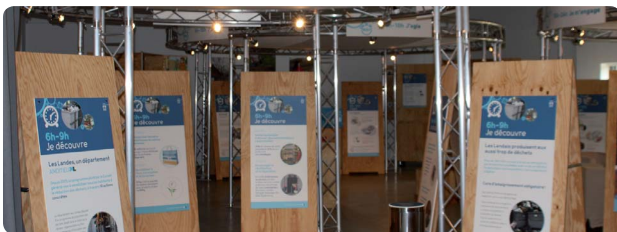
Une exposition pour le public scolaire et familial.

Une exposition sur la réduction des déchets est présente jusqu'au 15 décembre, à la salle des fêtes de Gibret. Ouverte aux scolaires de la primaire au collège, aux centres de loisirs et au public, cette exposition constitue une des actions du volet