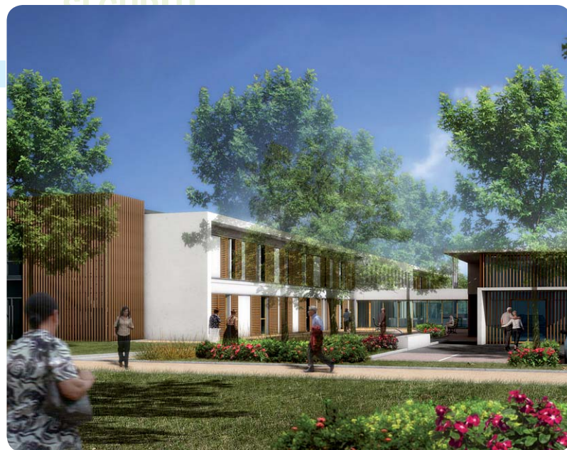
A Gamarde-les-Bains, des espaces verts riches en essences locales.

On vit aujourd'hui de plus en plus longtemps et c'est une bonne nouvelle. Les maisons de retraite doivent s'adapter et les équipes se former pour assurer un accueil optimal de nos aînés. La Communauté de communes investit dans une nouvelle maison de retraite à Gamarde-les-Bains et dans la rénovation de celle de Montfort-en-Chalosse.